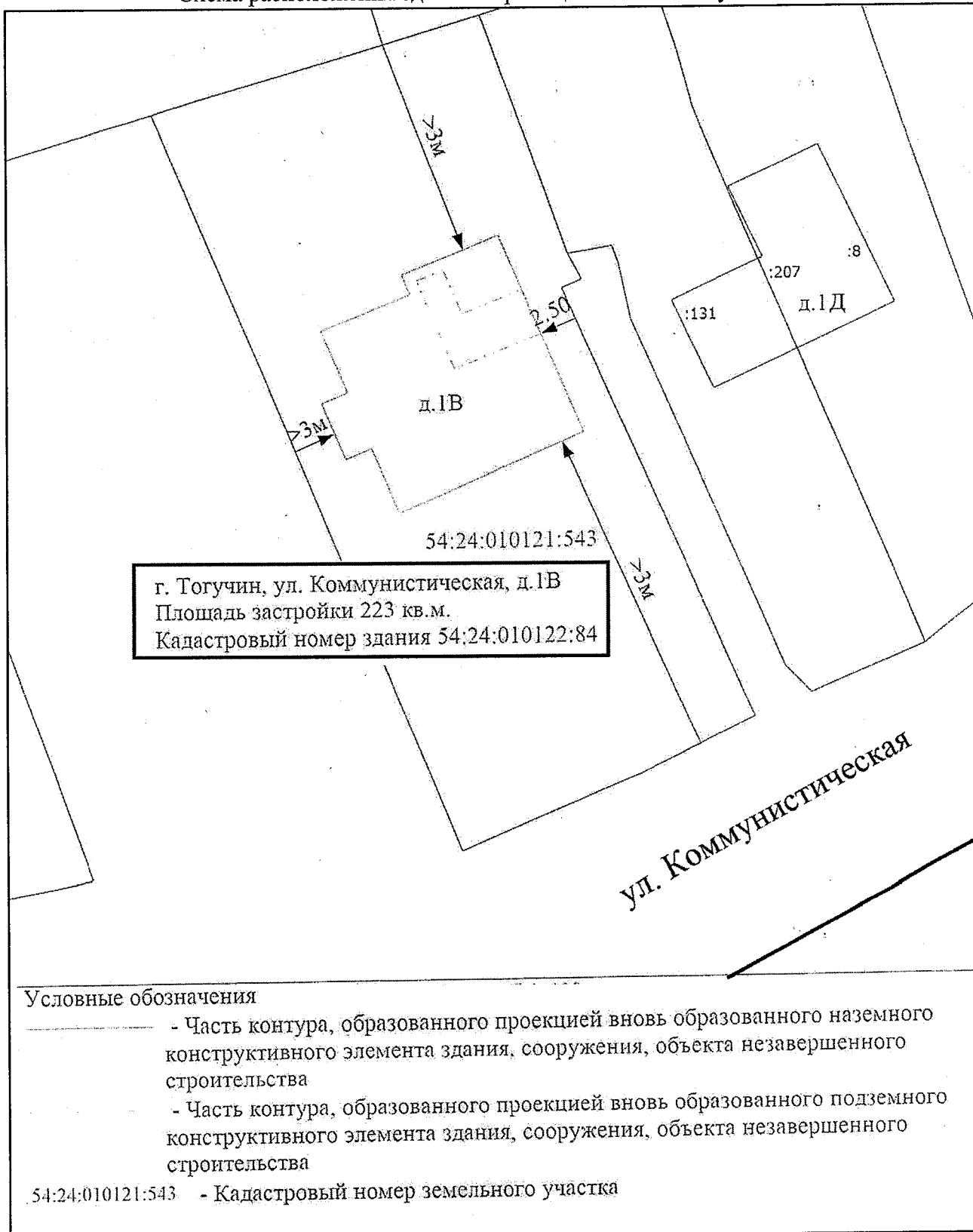
Схема расположения здания в границах земельного участка.