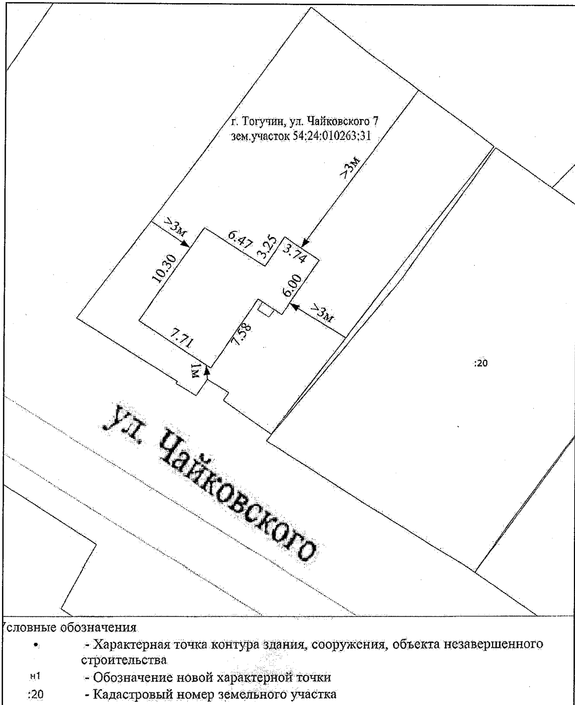
Схема расположения здания в границах земельного участка