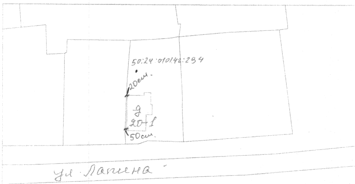
Схема расположенная объект недвижимости на земельном участке по адресу Тогучин ул. Лавина 20-1 кадастровый номер 54:24:010142:294